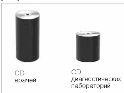
Рис. 1. Стопки CD-дисков первичной медицинской информации

Положим, что материализованная таким образом информационная медицинская услуга без промедления складывается в определенном месте в две стопки CD-дисков: CD-диски врачей и CD-диски диагностических лабораторий (рис 1).